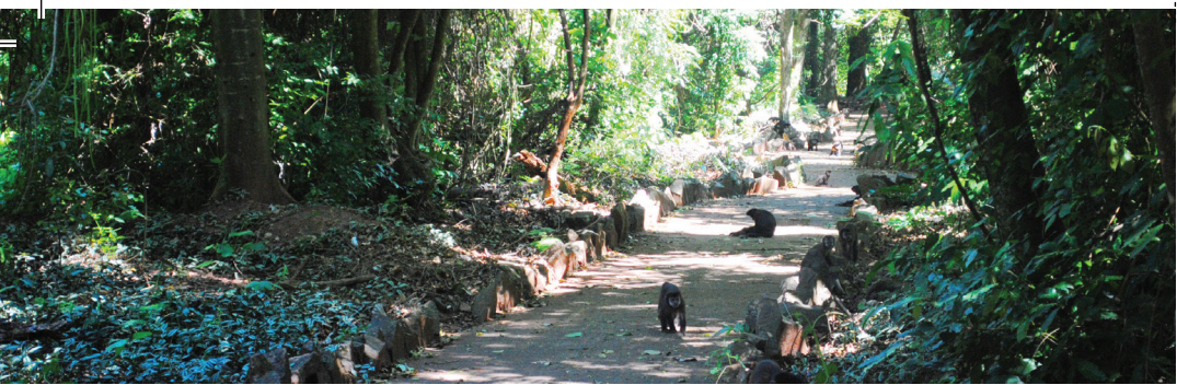
Parque Ecológico Municipal Danilo Marques Moura, Goioerê