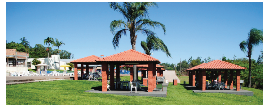
Clube de Campo, Goioerê

Hotéis, hotéis-fazenda e pousadas urbanas e rurais compõem a rede de hospedagem local, que é marcada pelo aconchego.