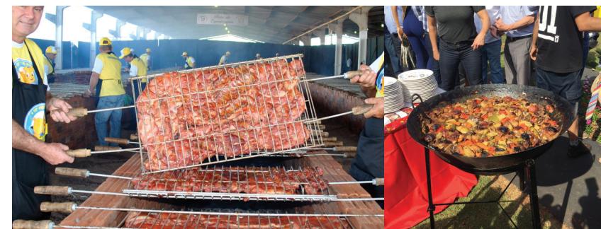
Festival do Leitão Maturado, Goioerê

Com saborosos e diversificados pratos típicos, a região se destaca no turismo gastronômico. São muitas as opções, principalmente de receitas à base de carnes. Que tal experimentar a Costela da Terra, de Terra Boa; a Paleta Tropeira, de Moreira Sales; e o tradicional Carneiro no Buraco, de Campo Mourão?