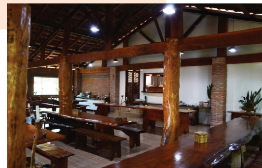
Fazenda Água Azul, Fênix

Próximo ao município de Fênix, o Hotel-Fazenda Água Azul oferece chalés e suítes em meio à natureza, cachoeiras e até um museu. O espaço conta ainda com área para eventos e um aeródromo. Não deixe de fora do roteiro uma visita à Fazendinha de Campo Mourão, pioneira no segmento.